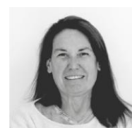
GABRIELLA GUERRA Ufficio stampa